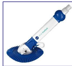
Limpiadores automáticos Puliscifondi automatici