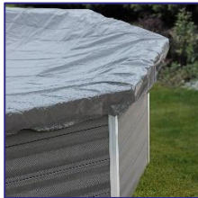
CIKPCO80 Cubierta de invierno Copertura invernale