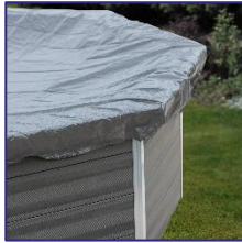
CIKPCOR60 Cubierta de invierno Copertura invernale