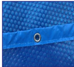
CVKPCOR60 Cubierta isotérmica Copertura isotérmica