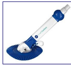
Limpiadores automáticos Puliscifondi automatici