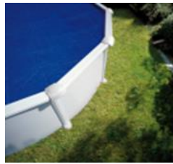
CV450 Cubierta Isotérmica Copertura Isotermica