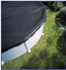
CIPR451/CIPR451P Cubierta de Invierno Copertura invernale