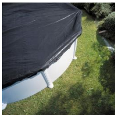
Cubierta de invierno Winter cover CIPROV501