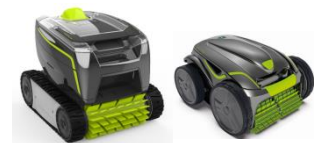
Robot Robot GT3220/GV3420