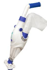
Limpiafondos eléctrico Electric vacuum VCB10